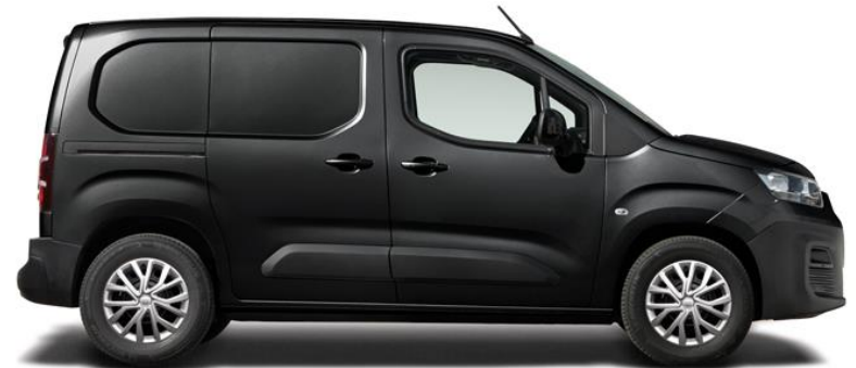
SVART, METALLIC (632), 5 500 kr

Villkor: Vänligen observera att viss standardutrustning, tillval, utrustningspaket och tillbehör kanske inte längre finns till försäljning på grund av rådande produktionsbegränsningar. För mer detaljerad information vänligen kontakta din auktoriserade Fiat Professional-återförsäljare. Alla nybilspriser i denna prisöversikt är rekommenderade priser inkl. leveranskostnader men exklusive moms. Denna prislista gäller från 1 mars 2023. * Den angivna förbrukningen är baserad på WLTP och blandad körning. Bilarna på bilderna är illustrativa och kan vara extra utrustade. Fiat Professional Sverige förbehåller sig rätten att ändra priser samt reserverar sig för eventuella tryckfel. Information om priser och utrustning samt specifikationer är av vägledande slag och kan ändras utan föregående meddelande. Kunder uppmanas alltid att rådfråga sin lokala återförsäljare för detaljerade specifikationer och inte basera beställningar enbart på rådande marknadsföringsbilder, utrustning och priser. Alla nämnda ansträngningar har gjorts för att innehållet i denna prislista skall vara uppdaterat och korrekt vid tryck tillfället. Importör: Italmotor Sweden AB. Kampanjpris gäller t.o.m 31 juni 2023