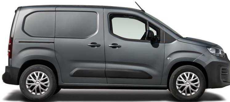
MÖRK GRÅ METALLIC (691), 5 500 kr