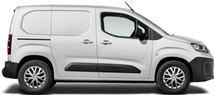
VIT, SOLID (549) standard lack