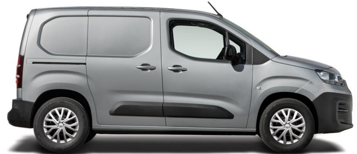
SILVER METALLIC (113), 5 500 kr